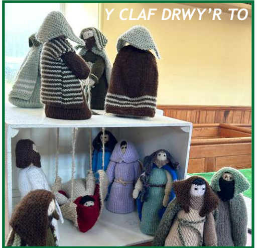
Y CLAF DRWY'R TO