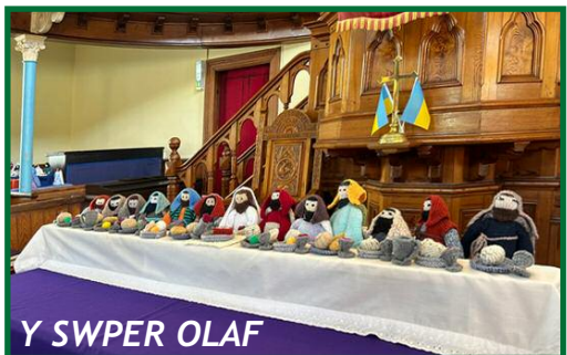
Y SWPER OLAF