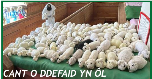
CANT O DDEFAID YN ÔL