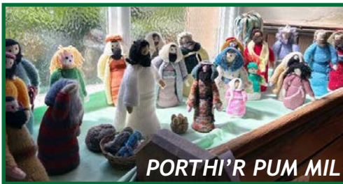
POR THI'R PUM MIL