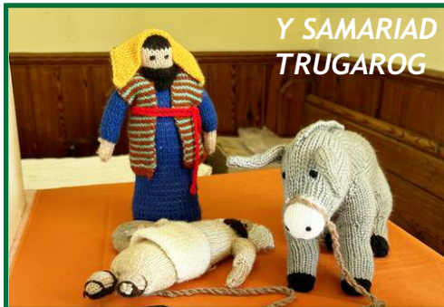
Y SAMARIAD TRUGAROG