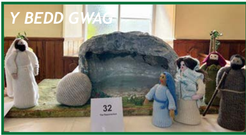
Y BEDD GWAG