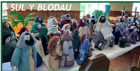
SUL Y BLODAU