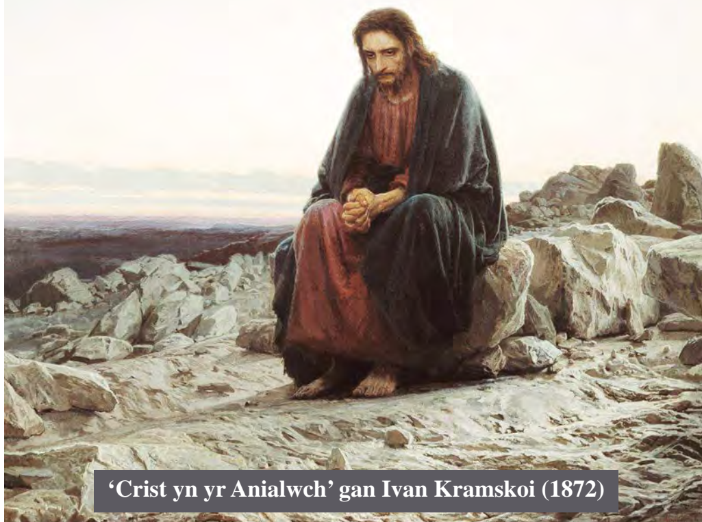
‘Crist yn yr Anialwch’ gan Ivan Kramskoi (1872)

Ddiwedd y 19eg ganrif yn Rwsia, paentiodd yr arlunydd a’r athro nodedig Ivan Kramskoi lun o Iesu wrtho’i hun yn yr anialwch, llun dirdynnol sy’n mynegi brwydr mewnol y corff a’r ysbryd. Mae ef wedi ei amgylchynu gyda meini bychain ac yn eistedd ar graig, ei ddwylo o’i flaen a’i lygaid yn llawn ing a gofid. Nid y Crist buddugoliaethus sy’n cael ei bortreadu yma ond Crist sy’n ymwybodol o ddifrifoldeb y frwydr, un sy’n cael profiad byw o beth yn hi i fod yn ddynol.