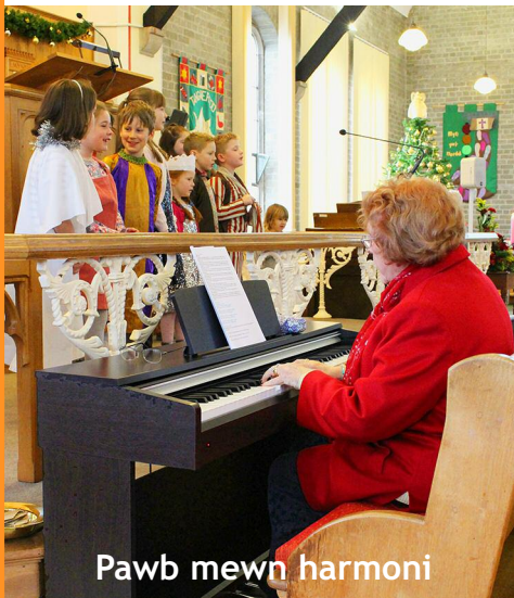
Pawb mewn harmoni