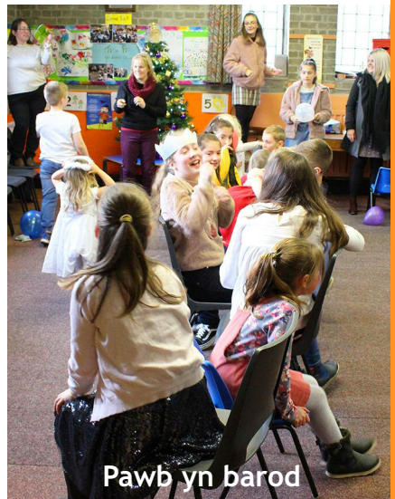
Pawb yn barod