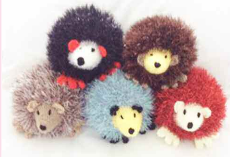
GWAU DRAENOGOD ER BUDD CYFEILLION YSBYTY GWYNEDD

Efallai cawn gyfle i gyfnewid Jig-so pan y daw'n ddiogel i ni fentro allan!!