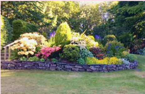
YN GWERTHFAWROGI'R ARDD FENDIGEDIG.