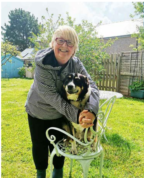
BU ANIFEILIAID HEFYD YN GWNEUD EU RHAN